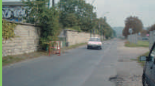
Le chemin de ronde à Croissy-sur-Seine, qui va être réaménagé.