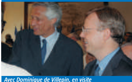
Avec Dominique de Villepin, en visite au Pecq-sur-Seine.