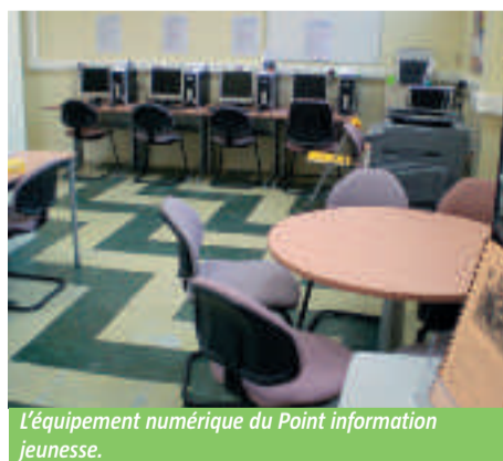
L'équipement numérique du Point information jeunesse.