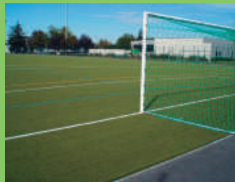
La nouvelle pelouse synthétique du stade de Croissy.

> Elle permet d'optimiser la fréquentation du stade puisque les temps de " repos " et d'entretien