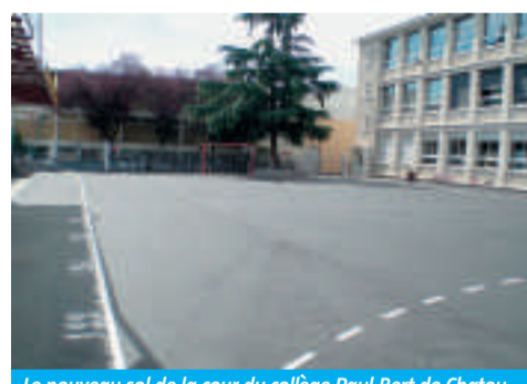
Le nouveau sol de la cour du collège Paul-Bert de Chatou.

Les années prochaines (2009/2010) verront une réhabilitation globale du collège pour un montant prévisionnel de 3 350 000 €. ■