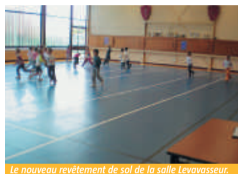
Le nouveau revêtement de sol de la salle Levavasseur.

La salle Levavasseur du gymnase Corbin, qui abrite les activités de la section escrime de Chatou, mais aussi des activités associatives (temps libre...) et de sport scolaire, a été rénovée par la municipalité, grâce notamment à une subvention de 24 600 € du Conseil général qui a permis le remplacement total du revêtement de sol de cette salle multisports. ■