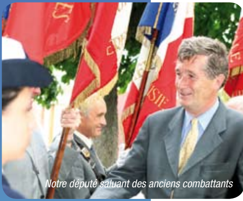
Notre député saluant des anciens combattants