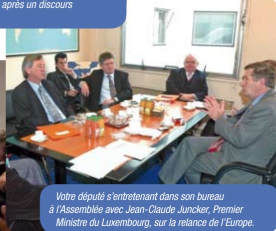
Votre député s'entretenant dans son bureau à l'Assemblée avec Jean-Claude Juncker, Premier Ministre du Luxembourg, sur la relance de l'Europe.