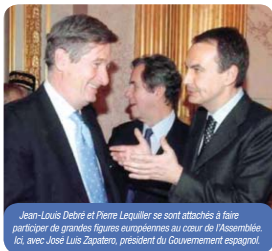
Jean-Louis Debré et Pierre Lequiller se sont attachés à faire participer de grandes figures européennes au cœur de l'Assemblée. Ici, avec José Luis Zapatero, président du Gouvernement espagnol.