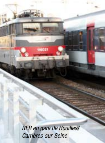
RER en gare de Houilles/Carrières-sur-Seine

Pierre Lequiller a obtenu une subvention du Ministère de l'Intérieur pour la création d'un nouveau poste de police municipale à Marly-le-Roi qui sera réalisé par la municipalité dans le Parc Witold à proximité des quartiers les plus peuplés de Montval et des Grandes Terres.