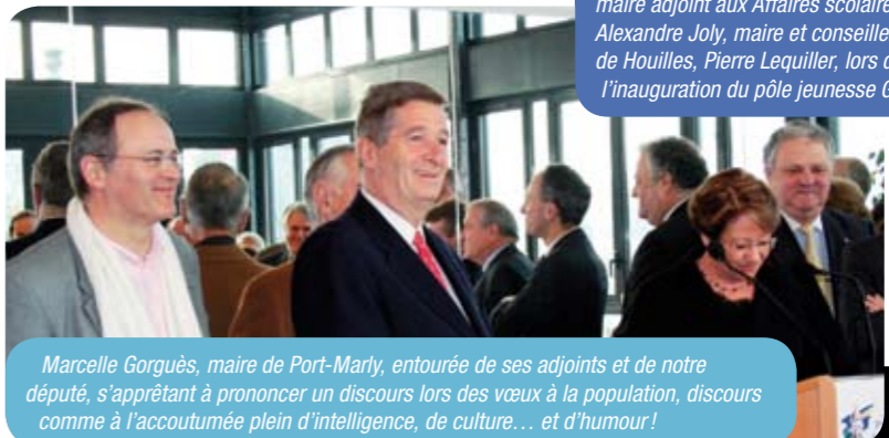
Marcelle Gorguès, maire de Port-Marly, entourée de ses adjoints et de notre député, s'appretant à prononcer un discours lors des vœux à la population, discours comme à l'accoutumée plein d'intelligence, de culture... et d'humour!