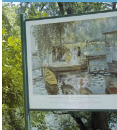
Le parcours des Impressionnistes est composé de 35 reproductions de peintres célèbres, à l'endroit même où ils avaient posé leur chevalet. Ici « La Grenouillère » d'Auguste Renoir à Croissy-sur-Seine. Notre député est à l'origine de cette réalisation.