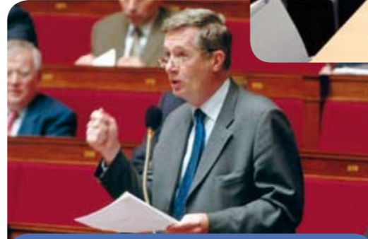
Votre représentant à l'Assemblée Nationale dans l'hémicycle intervenant dans un débat sur l'éducation.