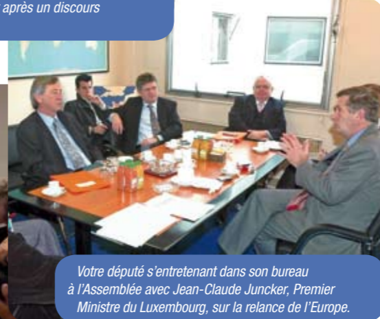
Votre député s'entretenant dans son bureau à l'Assemblée avec Jean-Claude Juncker, Premier Ministre du Luxembourg, sur la relance de l'Europe.