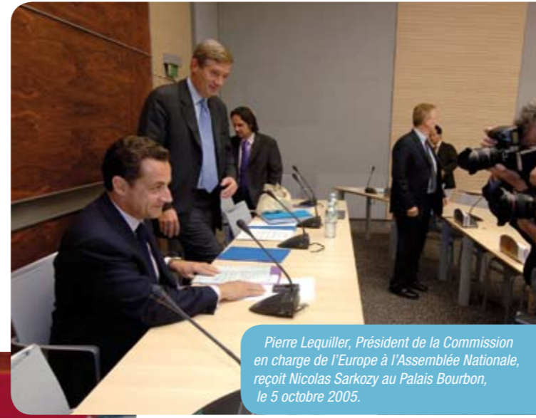
Pierre Lequiller, Président de la Commission en charge de l'Europe à l'Assemblée Nationale, reçoit Nicolas Sarkozy au Palais Bourbon, le 5 octobre 2005.