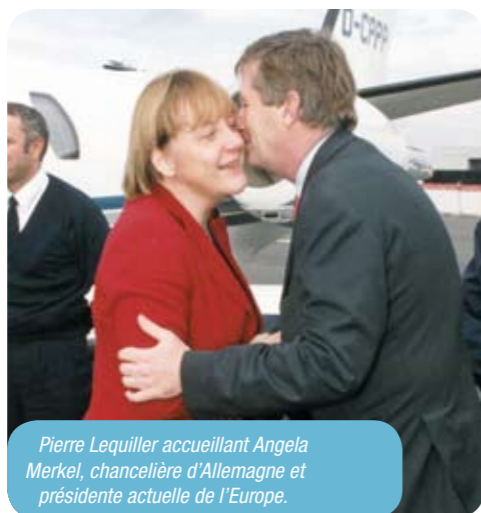
Pierre Lequiller accueillant Angela Merkel, chancelière d'Allemagne et présidente actuelle de l'Europe.

Depuis le « non » français au référendum, il a fait des propositions pour relancer l'Union qui ont été très remarquées en Europe. Parallèlement, il travaille sur le concept d'Union méditerranéenne proposé par le Président de la République. Il a été l'auteur de 86 rapports à l'Assemblée Nationale pendant ce mandat.